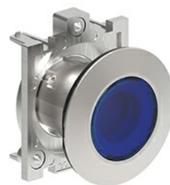
Przyciski podświetlane, samoczynny powrót - kryte LPFBL10