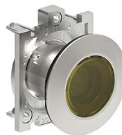
Przyciski podświetlane, samoczynny powrót - kryte LPFBL10