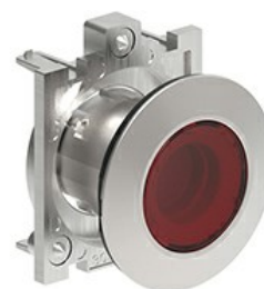
Przyciski podświetlane, samoczynny powrót - kryte LPFBL10