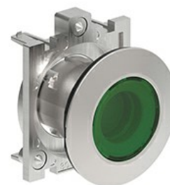
Przyciski podświetlane, samoczynny powrót - kryte LPFBL10