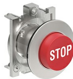
Przyciski, samoczynny powrót, z symbolem LPFB21