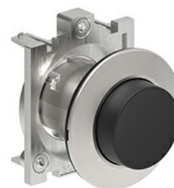
Przyciski, samoczynny powrót LPFB20