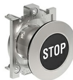
Przyciski, samoczynny powrót, z symbolem LPFB11