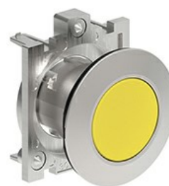
Przyciski, samoczynny powrót LPFB10