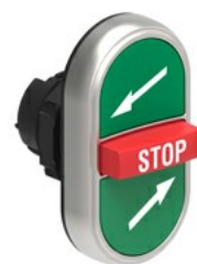
Przyciski trzyklawiszowe, samoczynny powrót - środkowy wystający LPCB73