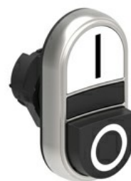
Przyciski dwuklawiszowe z samoczynnym powrotem – jeden wystający i jeden kryty LPCB72