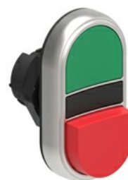
Przyciski dwuklawiszowe z samoczynnym powrotem – jeden wystający i jeden kryty LPCB72