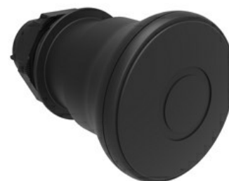
Przycisk do zatrzymania awaryjnego (grzybki), blokowany, odblokowanie przez pociągnięcie Ø 40 mm/1,6" LPCB674