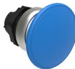
Przycisk do zatrzymania awaryjnego (grzybek), samoczynny powrót, Ø 40 mm/1,6" LPCB614