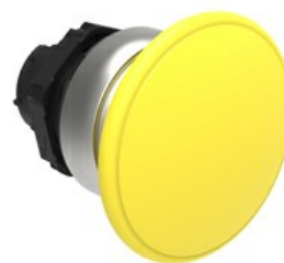
Przycisk do zatrzymania awaryjnego (grzybek), samoczynny powrót, Ø 40 mm/1,6" LPCB614