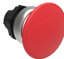
Przycisk do zatrzymania awaryjnego (grzybek), samoczynny powrót, Ø 40 mm/1,6" LPCB614