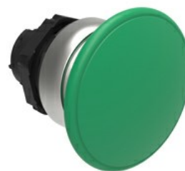
Przycisk do zatrzymania awaryjnego (grzybek), samoczynny powrót, Ø 40 mm/1,6" LPCB614