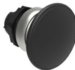
Przycisk do zatrzymania awaryjnego (grzybek), samoczynny powrót, Ø 40 mm/1,6" LPCB614