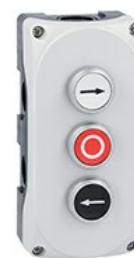
Pulsantiera grigia LPZP3A8 completa con pulsante rasato bianco "freccia destra" LPCB1148 1NA, pulsante rasato rosso "o" LPCB1104 1NC e pulsante rasato nero "freccia sinistra" LPCB1142 1NA LPZP3B8908