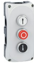
Pulsantiera grigia LPZP3A8 completa con pulsante rasato bianco "freccia su" LPCB1158 1NA, pulsante sporgente rosso "o" LPCB2104 1NC e pulsante rasato nero "freccia giu" LPCB1152 1NA LPZP3B8907