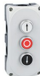
Pulsantiera grigia LPZP3A8 completa con pulsante rasato bianco "freccia su" LPCB1158 1NA, pulsante rasato rosso "o" LPCB1104 1NC e pulsante rasato nero "freccia giu" LPCB1152 1NA LPZP3B8906