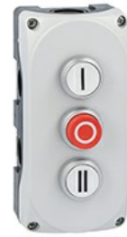
Pulsantiera grigia LPZP2A8 completa con pulsante rasato bianco "i" LPCB1118 1NA, pulsante sporgente rosso "o" LPCB2104 1NC e pulsante rasato bianco "ii" LPCB1128 1NA LPZP3B8905