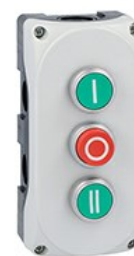
Pulsantiera grigia LPZP2A8 completa con pulsante rasato verde "i" LPCB1113 1NA, pulsante sporgente rosso "o" LPCB2104 1NC e pulsante rasato verde "ii" LPCB1123 1NA LPZP3B8903