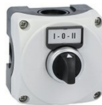
Pulsantiera grigia LPZP1A8 completa con selettore a leva lpcs130 2na e portaetichetta con etichetta "i-o- ii" LPZP1B8303