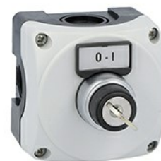
Pulsantiera grigia LPZP1A8 completa con selettore a chiave lpcs320 1NA+1NC e portaetichetta con etichetta "o-i" LPZP1B8302