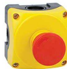
Pulsantiera gialla LPZP1A5 completa con pulsante a fungo con sgancio a rotazione LPCB6644 1NA+1NC LPZP1B5604