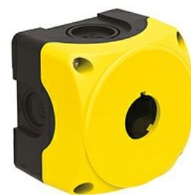
Pulsantiera plastica senza attuatori - per 1 attuatore LPZP1A5