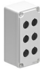
Pulsantiera con fori per operatori Ø22mm - 6 fori LPZM