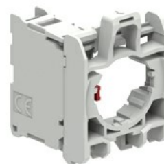
Elementi di contatto - con base di fissaggio LPXE