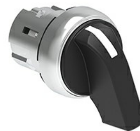
Operatori selettori leva lunga - 3 posizioni LPSS23