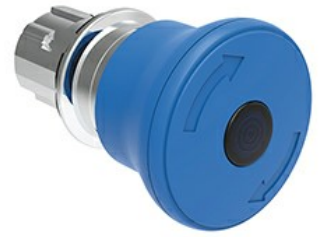
Operatore pulsante luminoso a fungo, ad aggancio sgancio a rotazione Ø 40mm LPSBL66