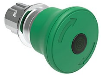
Operatore pulsante luminoso a fungo, ad aggancio sgancio a rotazione Ø 40mm LPSBL66