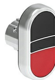
Operatori pulsanti doppi ad impulso - Con 2 pulsanti rasati LPSB71