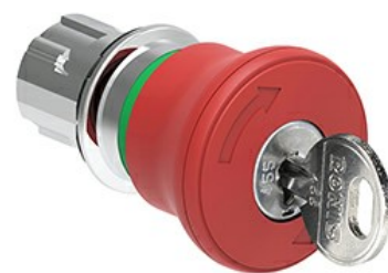
Operatore pulsante a fungo, ad aggancio sgancio a chiave Ø 40mm LPSB684