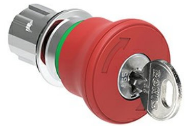
Operatore pulsante a fungo, ad aggancio sgancio a chiave Ø 40mm LPSB684