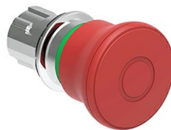
Operatore pulsante a fungo, ad aggancio sgancio a trazione Ø 40mm LPSB674