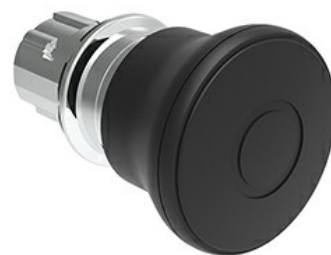
Operatore pulsante a fungo, ad aggancio sgancio a trazione Ø 40mm LPSB674