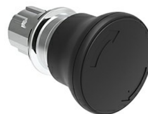
Operatore pulsante a fungo, ad aggancio sgancio a rotazione Ø 40mm LPSB664