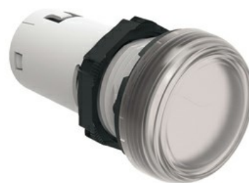
Indicatori luminosi monoblocco a LED a luce fissa LPML