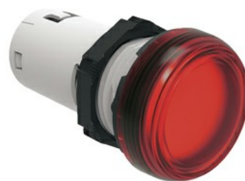
Indicatori luminosi monoblocco a LED a luce fissa LPML