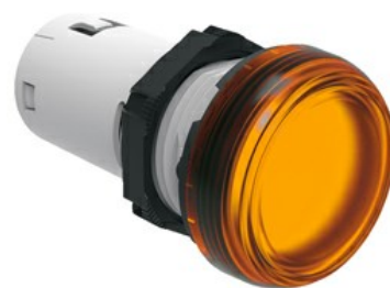
Indicatori luminosi monoblocco a LED a luce fissa LPML