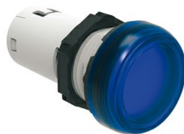
Indicatori luminosi monoblocco a LED a luce fissa LPML