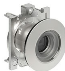
Operatore luminoso senza tappo LPFXQL0