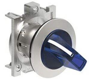
Operatori selettori a leva luminosi - 3 posizioni LPFSL13