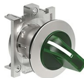
Operatori selettori a leva luminosi - 3 posizioni LPFSL13