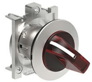
Operatori selettori a leva luminosi - 3 posizioni LPFSL13