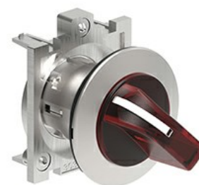
Operatori selettori a leva luminosi - 3 posizioni LPFSL13