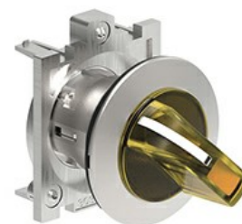
Operatori selettori a leva luminosi - 3 posizioni LPFSL13