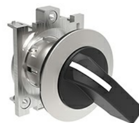
Operatori selettori leva lunga - 3 posizioni LPFS23