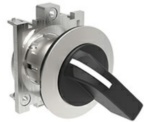
Operatori selettori leva lunga - 3 posizioni LPFS23