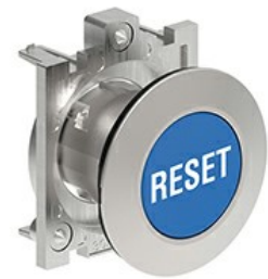
Operatori pulsanti ad impulso con simbologia LPFB11